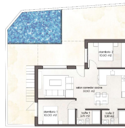
PB / GROUND FL.