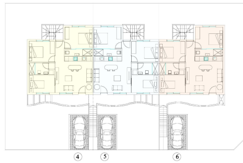
PENTHOUSE - PLANTA ALTA