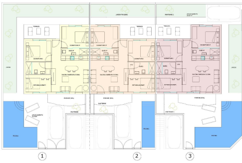
GROUND FLOOR - PLANTA BAJA