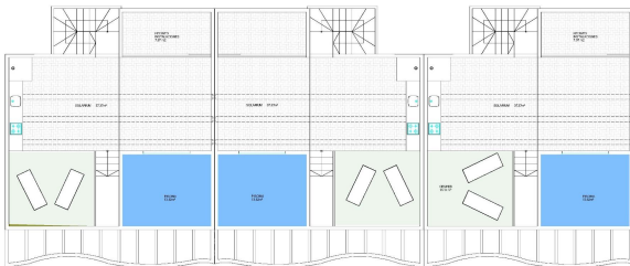
SOLARIUM - SOLARIUM