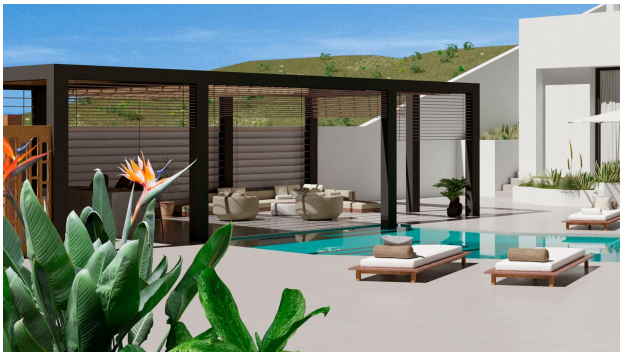
Level 0 / Garden Floor