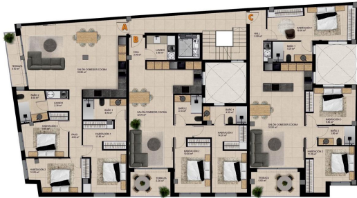
PLANTA PISO 1 y 2