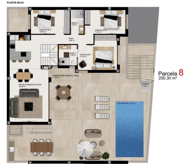
PARCELA 8 Sub. Construido Total 218,10 m 2 Sub. Construido Exterior 100,00 m 2 Sub. Construido Interior 118,10 m 2 Sub. Construido Terraza 17,70 m 2

LOS MUEBLES SE REPRESENTAN SOLAMENTE A TITULO DE REFERENCIA Y NO SON INCLUIDOS EN EL PROYECTO FINAL.