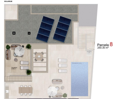
PARCELA 8 Sup. Construido Total 218,10 m 2 Sup. Construido Solares 100,00 m 2 Sup. Construido Planta Baja 100,00 m 2 Sup. Construido Terrace 17,70 m 2

LOS MUEBLES SE REPRESENTAN SOLAMENTE A TITULO DE REFERENCIA Y NO SON OBLIGATORIOS AL PROYECTO FINAL.