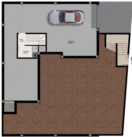
Parcela 8 250.30 m 2