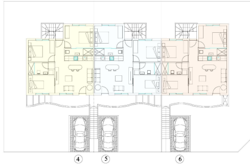
PENTHOUSE - PLANTA ALTA