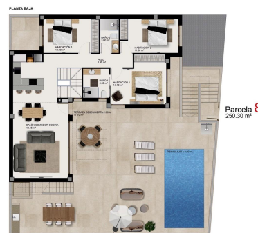
PARCELA 8 Sup. Construcción Total 218,10 m² Sup. Construcción Sótano 100,00 m² Sup. Construcción Planta Baja 100,00 m² Sup. Construcción Terraza 17,20 m²

LOS DIBUJOS SON REFERENCIALES Y NO SON OBLIGATORIOS PARA EL PROYECTO FINAL.